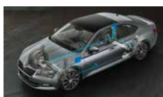
Adaptivní podvozek - volitelné nastavení podvozku ve 3 režimech (Comfort, Normal, Sport)

ŠKODA usnadňuje život svým zákazníkům každý den.