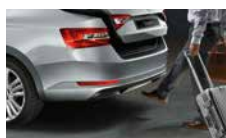
Virtuální pedál - bezdotykové otevření 5. dveří