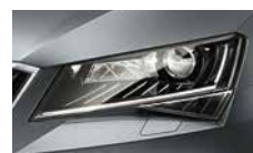
Smart Light Assist - automatické přepínání a clonění dálkových světel